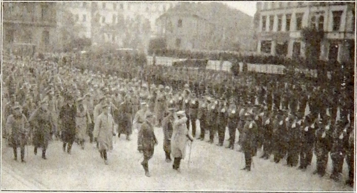
Rewja Wojskowa na Placu Saskim na Cześć Generała Józefa Hallera r. 1919.

Review of the Polish Army in the Warsaw Public Square by General Joseph Haller in 1919.