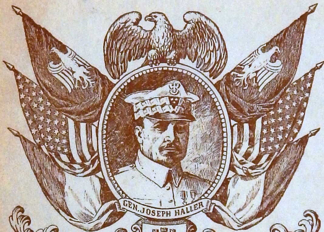
GEN. JOSEPH HALLER