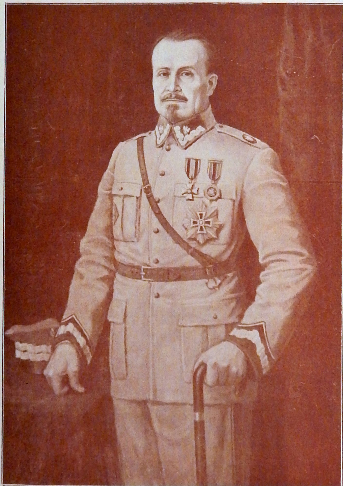
General Joseph Haller