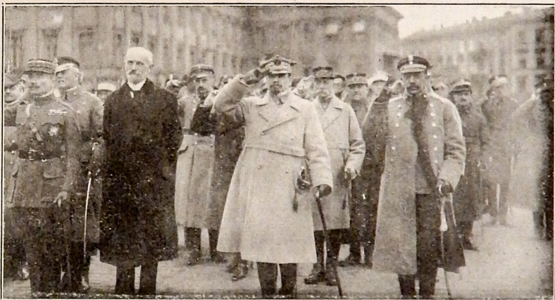
Rewja na Placu Saskim. Stoi na pierwszym planie General Francuski, Prezydent Wojciechowski, General Józef Haller i General Leśniewski, minister wojny.

General Joseph Haller standing rigidly at attention as the brave legions of the Polish Army marched in review before President Stanislaus Wojciechowski of Poland, Gen. Gouraud of the French High Command and Gen. Lesniewski, Polish minister of war.