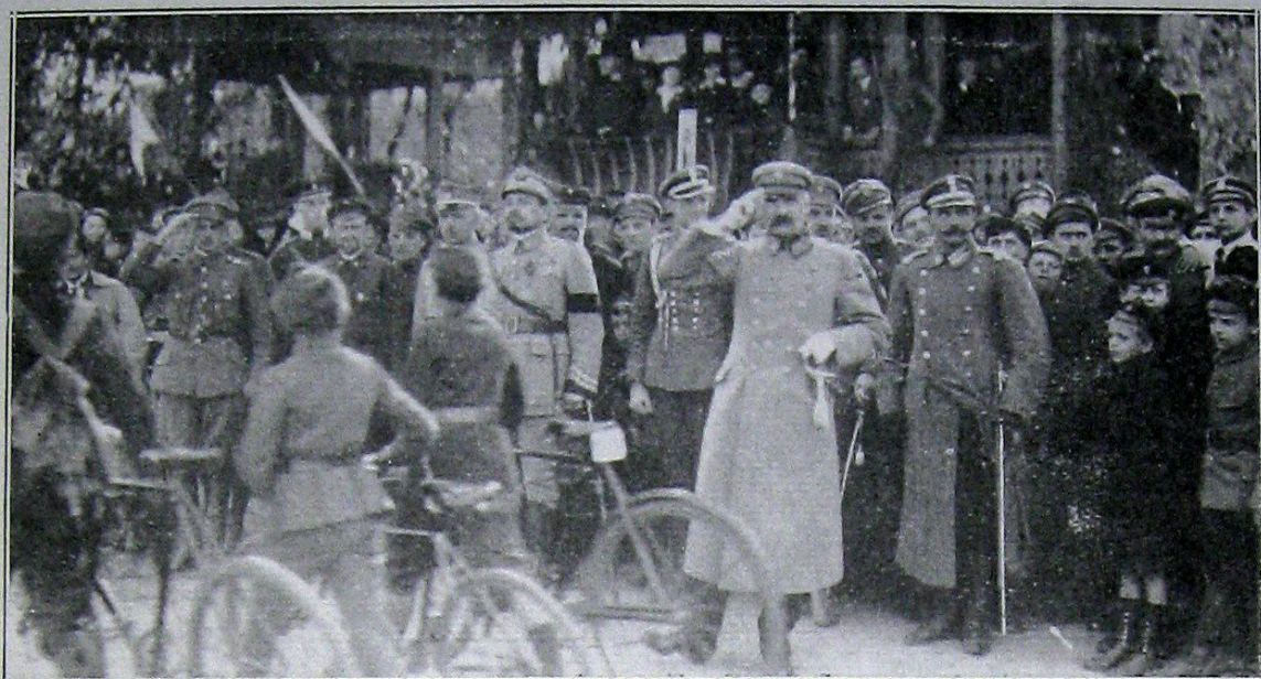
Zawody Harcerskie w Parku Sobieskiego w Warszawie w r. 1919.

Gen. Haller reviewing the Polish Boy Scouts at Sobieski Park, Warsaw in 1919.